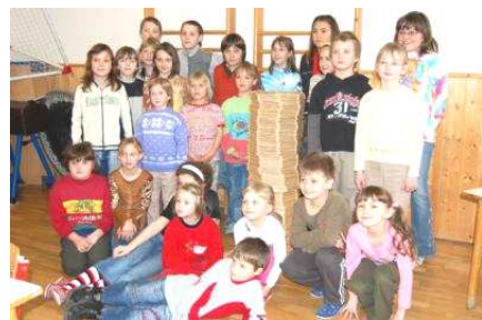
Velikonoční Věž pro kuře