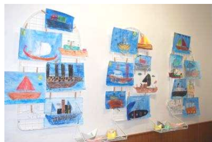
Vernisáž ve škole k projektu Voda