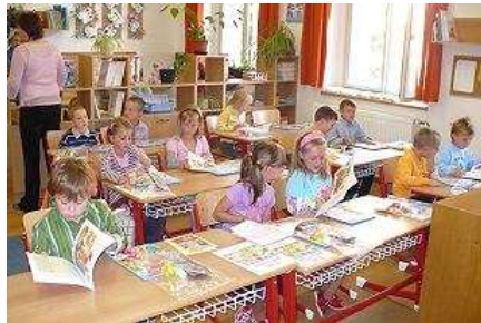
První školní den