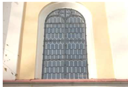
Oprava vitrážového skla