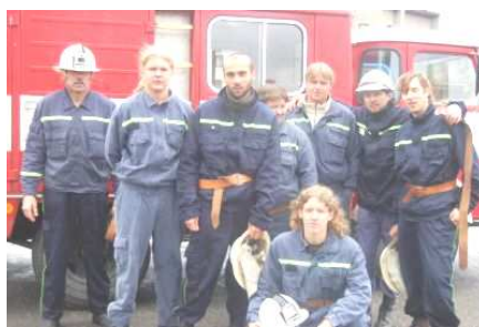
Soutěž o pohár IZS