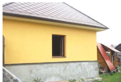
Oprava fasády na kolně