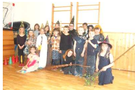
Malé čarodějnice ve škole