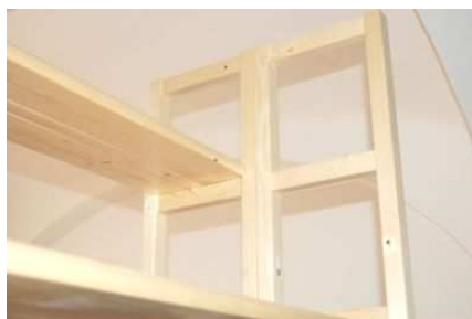
Rekonstrukce polnicového regálu v knihovně