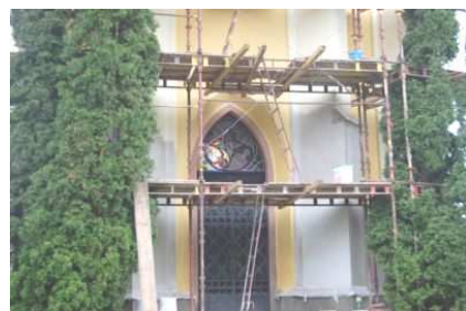
Dokončení opravy fasády na kapli