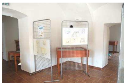
Nové výstavní panely a vitríny