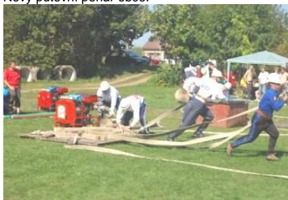
Soutěž o pohár starosty.