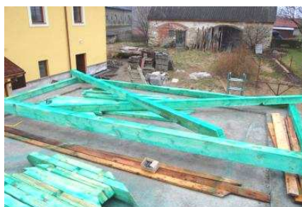
Montáž střeš na kolně