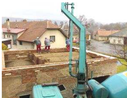
Betonáž na kolně u Staré hospody