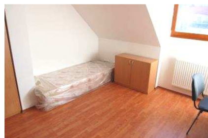
Den otevřených dveří