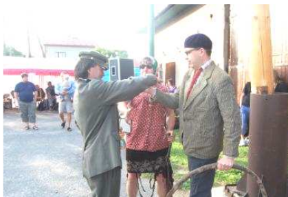
Kácení máje v netradičním čase.