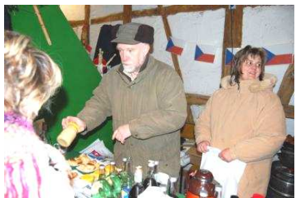
Adventní trhy v Lomenu

Toto je jen přehled části fotografií, které se podařilo pořídit během celého roku. Není možné dokázat zastihnout celý rok po vteřině, ale snažíme se zachovat do budoucnosti alespoň zrno toho, co se během roku událo.