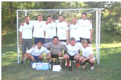
Turnaj v malé kopané