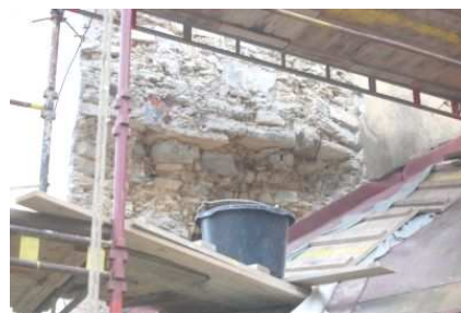
Oprava vnější omítky na kostele