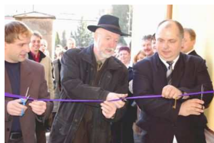
Slavnostní otevření bytů na staré hospodě