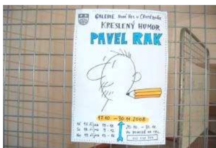
Výstava Pavla Raka