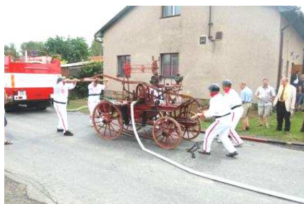
Oslavy 120.LET SDH