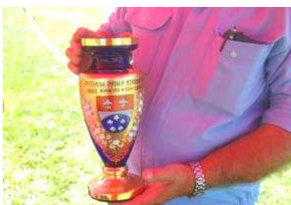
Nový putovní pohár obce.